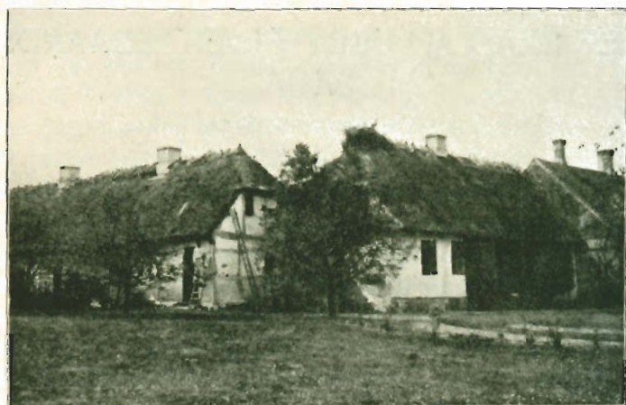
Ubby Præstegaards Stuehuse i 1926, sæte fra Nordsiden.

mærksomhed paa Bülow's Forbindelse med Ubby Præstegaard, var, at Bülow's Navn fandtes indridset i flere af Ruderne i omskrevne Østlænge. Paa en