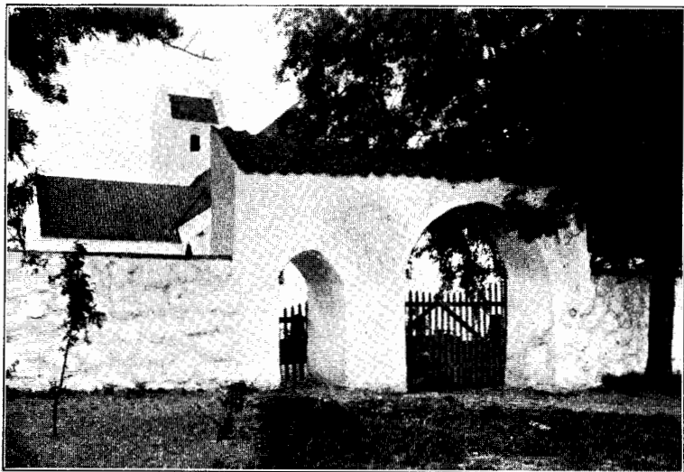
Fig. 3. Nordby Kirke.

Vi kommer nu til den Katastrofe, som i Middelalde-