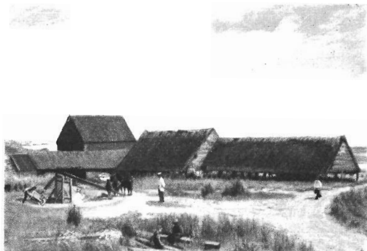
Riis teglværk i halvfemserne. Risegård står midt i billedet.

ket stenfrit lermateriale og teglværksler, lykkedes det mig at få et par kyndige mænd fra Kundby til at hjælpe mig at oprette et teglværk på stedet. Man lavede en grav der, hvor ovnen skulle være, og af det ler, man gravede op, strøg man de rå sten, hvorefter ovnen blev bygget. Så rejste man en tørrelade af nogle pæle i jorden og tag over af rør eller langhalm, og så kunne virksomheden begynde. Det er vist ikke for meget sagt, at det udlæg, der blev nødvendigt for at blive teglværksejer, ikke oversteg tusinde kr. Den første ovns sten var vellykket, og deraf blev det meste straks solgt og brugt til opførelse af Asnæs præstegård.